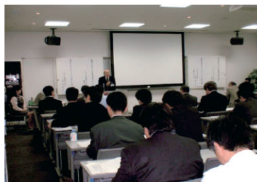
・第2回講演会の様子