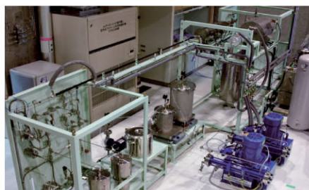
● 超臨界二酸化炭素循環試験装置

以上のような連携研究体事業の成果を基にエンジニアリングベンチャーを起業し、超臨界流体技術の汎用的実用化普及拡大を推進する予定です。