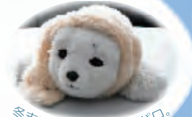
冬支度の東北センターパロ。

URL: http://unit.aist.go.jp/tohoku/asist/ Tel.022-726-6030