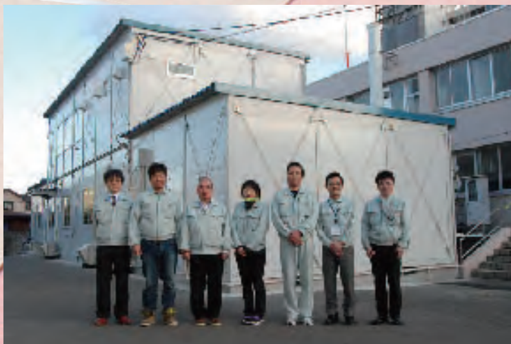
プレハブ仮事務所の前で NITE 東北支所のみなさん

震災の影響で庁舎が使えなくなったため、独立行政法人製品評価技術基盤機構（NITE）東北支所の方々が産総研東北センターの事務室を使って業務をしていました。庁舎の本格的な復旧工事は本年秋から開始するとのことですが、このたびプレハブ仮事務所が完成し、平成24年1月東仙台に戻られました。