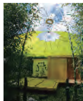
ユネスコ庭園内《茶室》入口、パリ、1993 年

『シャルロット・ペリアンと日本』 「シャルロット・ペリアンと日本」 研究会編、鹿島出版会、2011 年