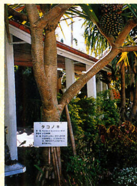
写真2 タコノキの気根(沖縄県)

このほか、気根を持つタコノキ科タコノキ属(パングス属)は、世界の熱帯地域に約650種類あるといわれますが、その中のタコノキは小笠原諸島原産です。樹高10m以下程度の常緑低~高木で、葉は頂生で群がって生えます。筆者の髪の毛も頂生ですが、群がっていたのは遙か昔のことです。閑話休題。イチョウと同様に雌雄異株で、特に雄株は幹下部から下向き放射状に多数の気根をだし、タコの足状となることに名前が由来しています(写真2)。↘