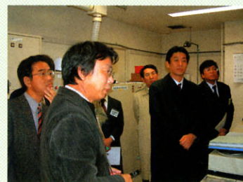
センター見学の様子

意見交換においては、新たな連携のあり方などについて活発なやり取りがなされ、今後も同様の会合を持ちたいということで会を締めくくった。