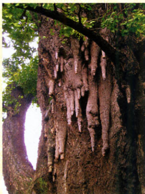
写真1 「苦竹のイチョウ」の気根(宮城県)

さて、「苦竹のイチョウ」は、全国的に有名です。大正15年(1926)10月20日に国指定天然記念物となりました。仙石線「宮城野原」駅東方徒歩10分の宮城野八幡神社の裏手の私有地内にあります。雌樹で、樹高27~32m、幹周囲約8mあります。気根(後述)が乳房状を呈するので「乳イチョウ」とか「姥イチョウ」と呼ばれ母乳不足に悩む女性たちの信仰を集めたといえます。気根の大きなものは長さ約3m、周囲1.7mで、支柱根となっているものもあります(写真1)。樹齢1,200年と推定されています。奈良時代の聖武天皇の姥、紅白尼の遺言でその塚の上に植えられたとの言い伝えです。この場所はもともと「苦竹」という地名でしたが、この樹にちなんで「銀杏町」となりました。↙