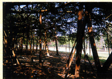
写真3 バニヤン樹(ガジュマル)の気根(インド)

さて、世界最大の気根はどこにあるのでしょうか。インド北西部に位置するカルカッタのフーグリー川西岸の植物園は、イギリスによるインド統治時代に東インド会社が東南アジアの有用な樹木を収集栽培したのが始まりです。約12,000種以上もあるという中に、バニヤン樹(ガジュマル)という熱帯アジアに分布する桑科の常緑高木があります。特に、Great Banyan Treeと称される樹は、樹高25m、樹齢240年ですが、なんとといっても広がり周囲が420mもあります。感動ものです。どうしてこんなに張り出せるかということ、次々と気根が生成成長して支柱となって本体を支えて広がっていくため、気根の総数は2,800本といわれます。写真3で多数の幹のように見えるのはすべて気根なのです。まさに世界最大級です。カルカッタに行く機会があったら是非見てきてください。