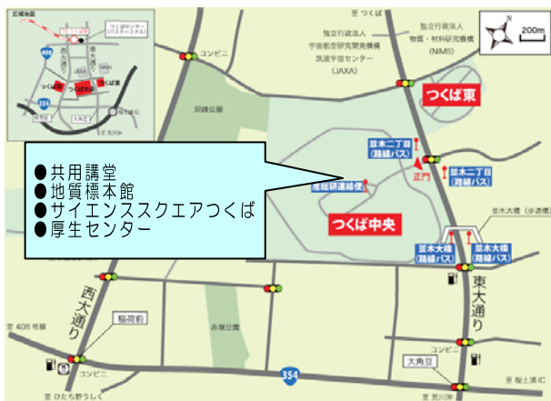
図1 つくばセンター周辺マップ