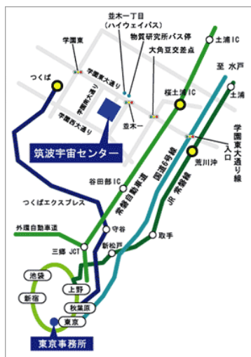
図3 筑波宇宙センターマップ