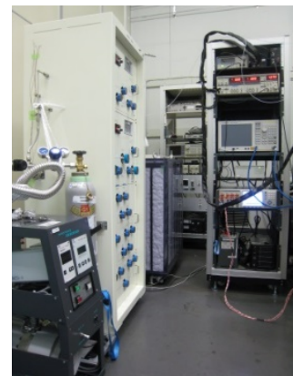
音響気体温度計システム