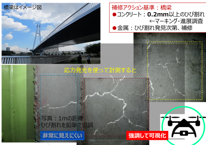
応力発光によるインフラ診断（ひび割れ検出）