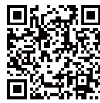
お申込みフォーム

以下のお申込みフォームより、お気軽にお申込みください。 http://openfacility.sec.tsukuba.ac.jp/public/form20190530/