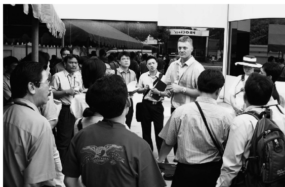
写真4：燃料油メーターの実地指導（2005年）

このような長期間となった理由は、通常の燃料油メーターだけでなくLPG（液化石油ガス）燃料油メーターも本格的な研修対象としたためである。その背景にはアジア諸国で自動車用燃料としてのLPGの使用が拡大しているという事情があった。またLPGおよび通常タイプの二種類の燃料油メーターにつき、それぞれ近郊のガソリンスタンドを利用した実地研修を盛り込み、さらに現地チョンブリ州の東部検定センターの訪問も行った。この研修は海岸リゾートであるパタヤで開催され、休日にはホストが近隣の観光ツアーも用意してくれたため、研修以外でも何かと思い出が多い。そのため研修生や講師との連帯感も、他の研修に比べてより色濃く残っている。