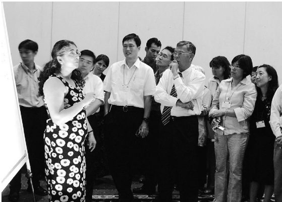
写真6：OIML-R87(包装商品)に関する研修(2006年)

ラベル表記に対する要請)があるが、中でも R 87 の理解とその普及を主要なテーマとして、2回の研修をマレーシアにおいて行った。