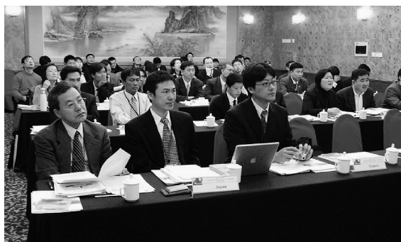
写真8：電力量計セミナー（2007年）

化、高機能化、低コスト化を図る上で極めて有益であり、計測データの自動転送の可能性も開ける。しかしその反面、耐用年数、電源ノイズの影響、計測ソフトウェアや転送データの信頼性などの点で課題を残している。