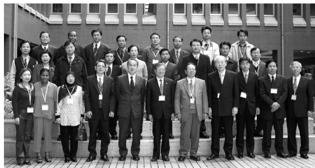
写真10：電子体温計セミナー（2005年）

一連の医療機器セミナーで特徴的だったのは、現地医療機器メーカーの参加者から、日本における医療機器の規制や規格に関して積極的な質問が多く出された事である。どうも彼らにとって、日本は参入しにくい市場の一つらしい。医療機器の規格や規制については、世界の地域ごとに独自だがある部分は類似した業界主導の規格が併存している。また医療計測機器は計量標準と医療の両分野に深く関わっており、管轄省庁が二つに分かれている場合も多い。ちなみに台湾では、日本を手本にした電子血圧計の型式承認・検定制度の導入を進めており、これらのセミナーもそれに向けた重要なイベントとして位置付けられていたようだ。