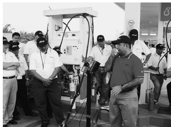
写真5：NGV燃料油メーター実地指導（2007年）

開催地としては、産油国でありCNGを使う自動車（NGV）が普及している状況を考えて、2回ともマレーシアが選ばれた。うち初回の講師は米国カリフォルニア州から招いたが、2回目は現地計量機関（SIRIM）とマレーシアを代表する石油会社であるペトロナス社から2名の専門家が参加した。