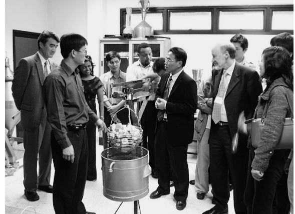
写真 11：農産物ワークショップ（2007年）

理解の共有、検査機関相互の比較測定や技能試験 (PT) の充実、国家計量機関 (NMI) の役割の重要性、他の国際機関や地域機関との連携、計測の社会基盤整備の必要性、農産物の品質管理、商品のラベル表示に関する課題、等々であった。