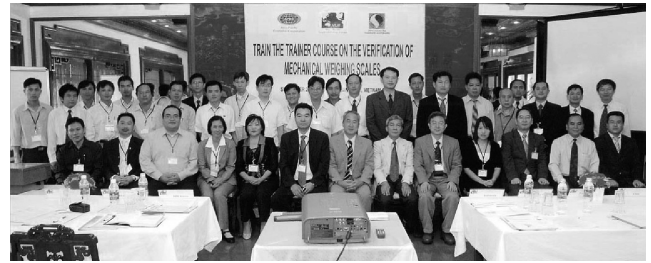
写真2：非自動はかり研修（2007年）

でも機械式ばかりに対する根強い要望があった。講師は前回に続いてNMIJから参加したが、期待通り機械式へのニーズは大きく36名もの研修生が参加した。さらに今後の機械式ばかり研修の継続に対する要望も多かった。