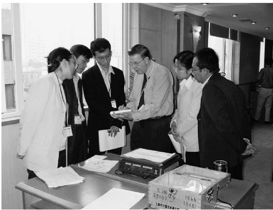
写真1：非自動はかり研修（2004年）

研修生による自国の計量事情の報告、グループごとの成果発表とディスカッション、そして対象計量器に関する現地の試験機関やメーカーの訪問によって構成される。上海での研修(写真1)では主な講師はオーストラリアから参加し、NMIJは特別講演という形で2名の講師を派遣した。オーストラリア講師による講義は、非自動はかりの基本原理や歴史に始まり、オーストラリアにおける検定制度に至る広範な内容であった。NMIJの講師はそれを補う形で、非自動はかりに関する我が国の法定計量事情と計量器ソフトウェア規制の状況に関する講演を行った。