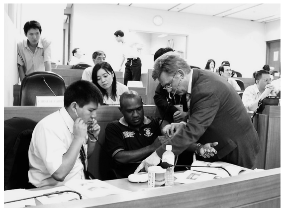
写真9：自動血圧計セミナー（2006年）

電子血圧計に関する2004年のセミナーでは、米国のGEヘルスケア社およびドイツのPTB（国立物理工学研究所）から講師を招いた。2006年のセミナー（写真9）では、前回と同じPTBの講師に加え、前回は研修生であったNMIJ専門家が講師として参加し、主に日本における電子血圧計の計量管理や型式承認に関する講義を行った。2回のセミナーを通して、