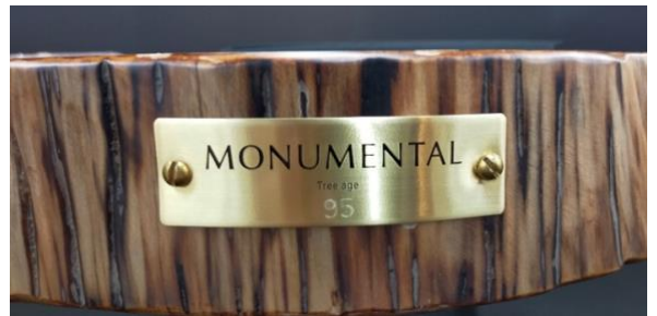
年輪数が刻印されたプレート

令和3年度に参加した株式会社ウエキ産業も意匠権出願中です。本事業で開発した製品は、大川展示会「大川夏の彩展 2022」（2022年7月）に出展しました。そこで、“形も大きさも違う世界でたった一つの国産年輪材を使った家具