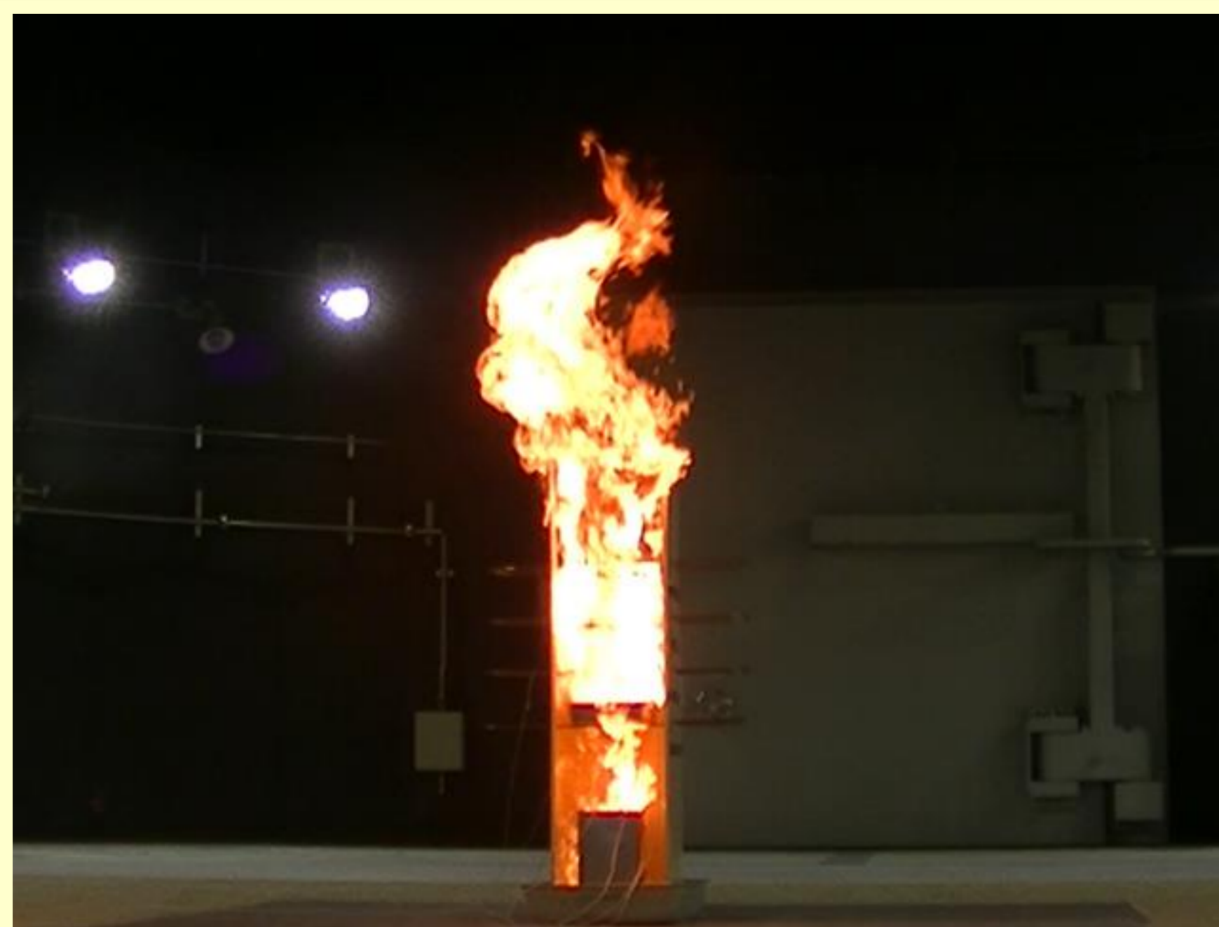
大規模な発火、燃焼などの試験が可能