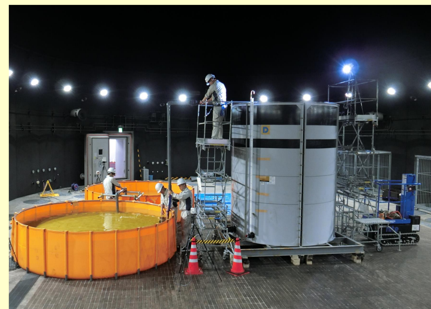
大型電気製品等の水没試験