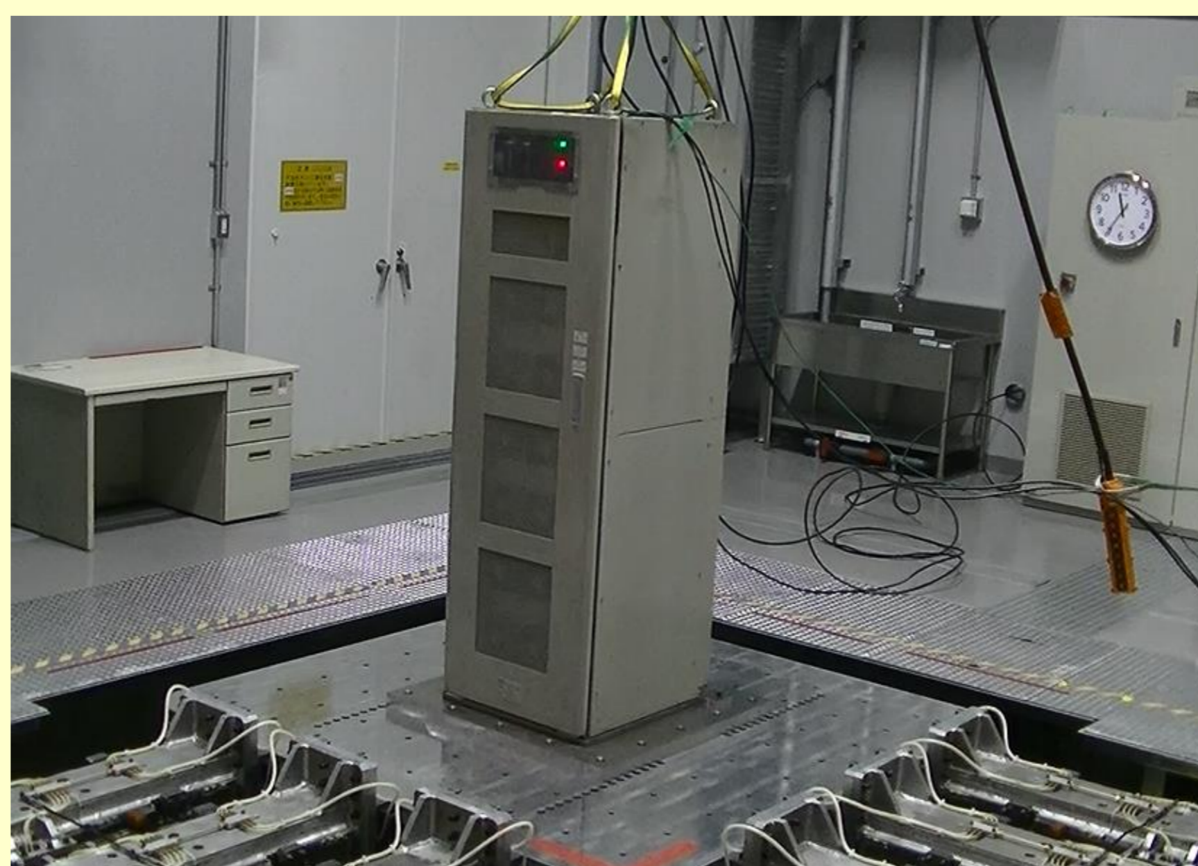
実使用を想定した試験(地震波)