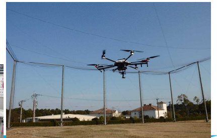
ドローンテストフィールド