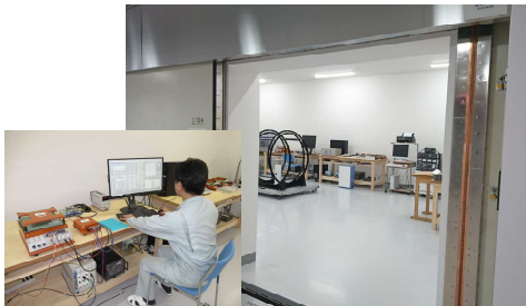
大型磁気シールドルーム