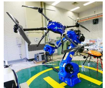
ドローンアナライザ