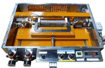
応力負荷型単板磁気試験器 【高精度磁気特性測定】