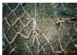
陸上で30年間以上 (海中では約20年間)