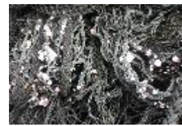
海藻が付着しており、最低でも年に一度は清掃が必要