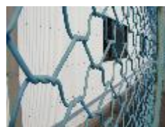
沿岸地域で約5年間 (海中では約3年間)