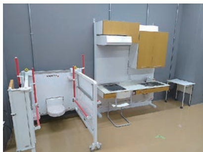
模擬環境 (トイレ・キッチン)