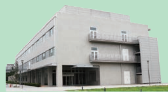
産業技術総合研究所 柏センター

その中で機器開発に役立つドキュメント類を整備し、機器のコンセプトや安全性の確認ができるようにしてきました。これらの経験を元に、介護ロボットのコンセプト評価や安全性検証、介護現場における評価計画などのお手伝いやアドバイスをいたします。