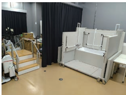
模擬環境 (浴室・階段)