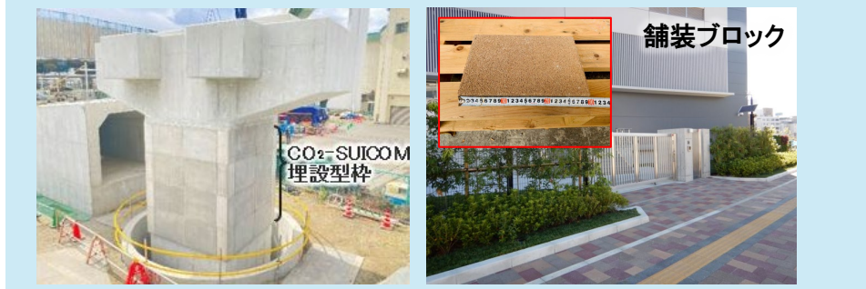
図2：CO 2 -SUICOM ® の技術を用いたコンクリート製品

公的資金の活用状況 (提供元、資金名、活用期間、スキーム等) ● NEDO, 「グリーンイノベーション基金事業 / CO 2 を用いたコンクリート等製造技術開発プロジェクト」, 2021年度～