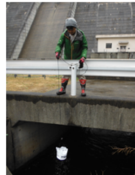
橋の上からの採水