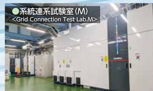
●系統連系試験室(M) <Grid Connection Test Lab.M>

20ftコンテナを収容可能な国内最大の系統連系試験室です。2024年度より、5MWまでの系統連系試験に対応可能となりました。