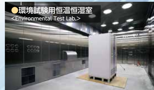
●環境試験用恒温恒湿室 <Environmental Test Lab.>

スマートシステムに不可欠なパワーエレクトロニクス機器、ICT機器のEMC(電磁両立性)試験にご利用頂けます。国内最大級の電波暗室はテニスコート約5面分の広さです。大電力使用可 AC420V/1.5MVA DC550kW×4台