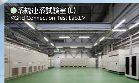
●系統連系試験室(L) <Grid Connection Test Lab.L>

砂漠地、高温湿潤地、極寒地での使用を想定した温度サイクル等の環境試験が可能な大型の恒温恒湿実験室です。設定温度範囲はマイナス40℃~プラス85℃、湿度範囲は30~95%RHに対応できます。雨水散水試験対応可。大電力使用可 AC3MW(高圧)または AC420V/1.5MVA DC550kW×6台