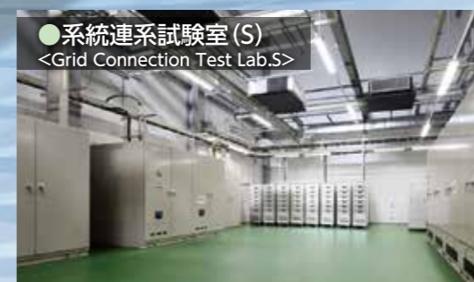
●系統連系試験室(S) <Grid Connection Test Lab.S>

20ftコンテナを収容可能な国内最大の系統連系試験室です。2024年度より、5MWまでの系統連系試験に対応可能となりました。