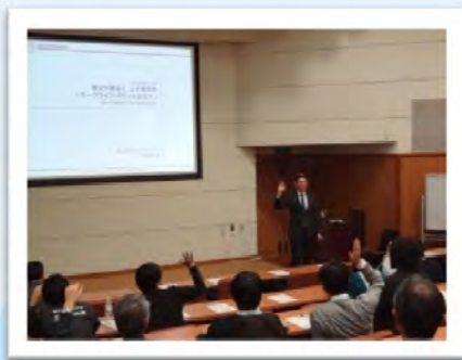
ワークライフバランスに関する講演会

今後とも、DSO参加機関の取組も参考にさせていただきながら、男女共同参画を推進していきたいと考えおりますので引き続きよろしくお願いいたします。