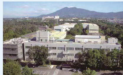
土木研究所(つくば市)

研究所は、つくば中央研究所(茨城県つくば市)、寒地土木研究所(北海道札幌市)を中心に465人の常勤職員がおり、男女比は男性405人、女性60人となっています。