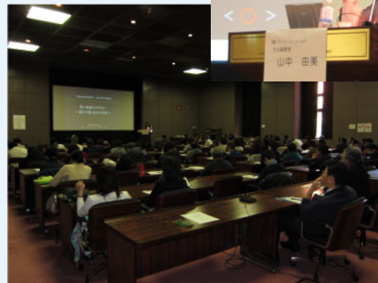
つくば会場の様子

また、質問にも丁寧にお答えいただきました。遠距離介護では自治体のサービスを調べて利用すべき、施設に入居する場合には事前に調査し現地で五感を使って確認すべき、お勧めしない施設、ケアマネージャーは複数の選択肢を提示する人がベター・合わないと思ったら我慢せずに人を替える・甘やかす人はNG、介護をめぐる動向では、次回制度改正・財源策・介護職・高齢者住宅の再編、に注視すべき、介護用品の購入についてのアドバイス等、具体的なお答えをいただきました。