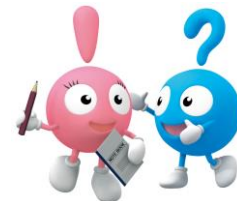
産総研ありす 産総研てれす