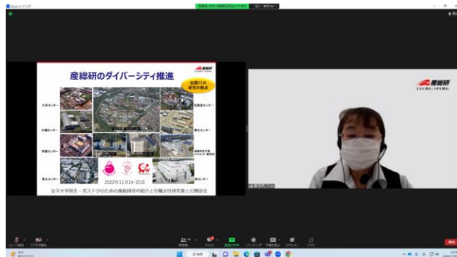
ダイバーシティ推進の紹介の様子