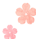
3月の農研機構本部の様子 (茨城県つくば市)