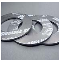
【高性能ガスケット】 ※東北のプラントで採用 2011年度産学官連携功労者表彰 -経済産業大臣賞 受賞 (ジャパンマテックス株式会社)