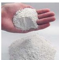
【粘土膜用特殊粘土】 2011年度産学官連携 功労者表彰-経済産業大臣賞 受賞 (クニミネ工業株式会社)