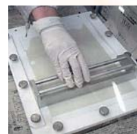
【ラボ用粘土膜製膜器】 水系・各種有機溶剤に 対応しています (株式会社ジー・イー・エス)