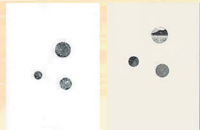
『技術解説書』、『技術解説書2012』を発行。 会員様に進呈しております。