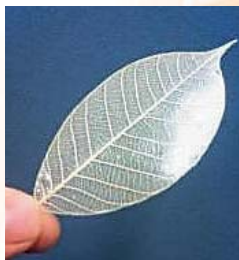
クレーストをコーティング することで酸素等による 劣化防止が期待されます。