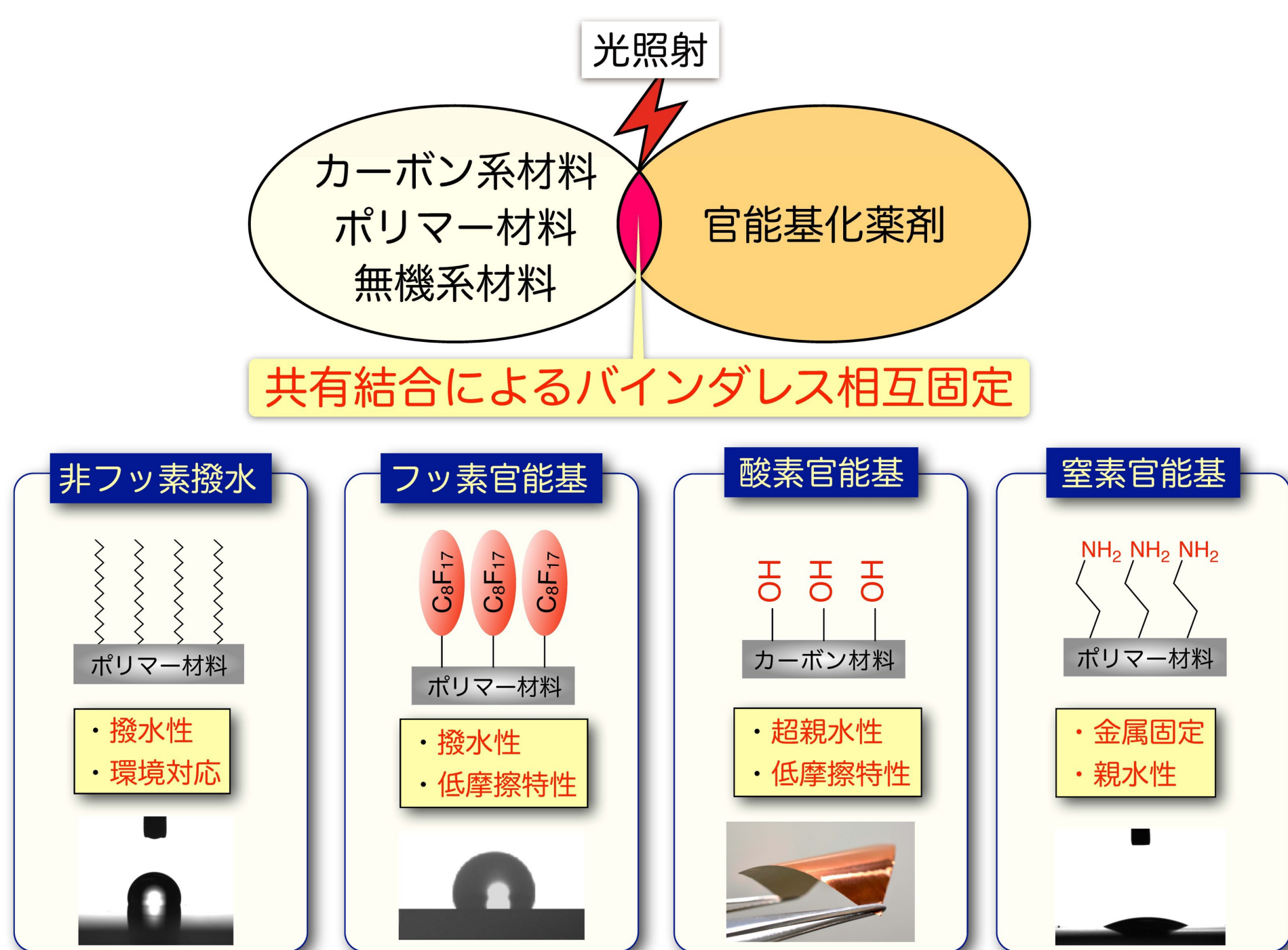
各種材料への表面化学修飾ナノコーティング技術開発