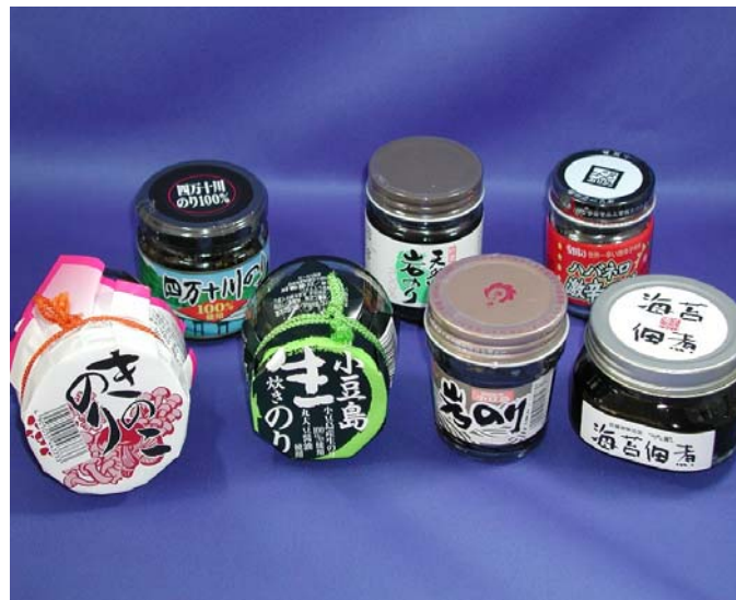
図1. 1-1 ノリ佃煮製品

海苔佃煮の原料は、一般的には、アオノリ、アオサノリ（ヒトエグサを含む）である。瀬戸内海では、スサビノリが生息しており板海苔の原料として利用されているが、スサビノリを原料として海苔佃煮を製造している企業もある。海苔佃煮の中には、シイタケ、ナメタケ、きのこ、唐辛子、にんにく、わさび等を加えて味・香りを強調している製品がある。ノリ佃煮は、醤油、砂糖、水飴、ソルビット、調味料（アミノ酸等）、着色料、増粘多糖類、酸味料、甘味料を加えて製造されている。図1. 1-1にノリ佃煮製品を紹介する。