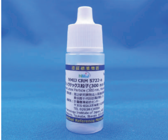
NMIJ CRM 5722-a ポリスチレンラテックス粒子 (300 nm・単分散) Polystyrene Latex Particles (300 nm, Monodisperse) (P. 17)