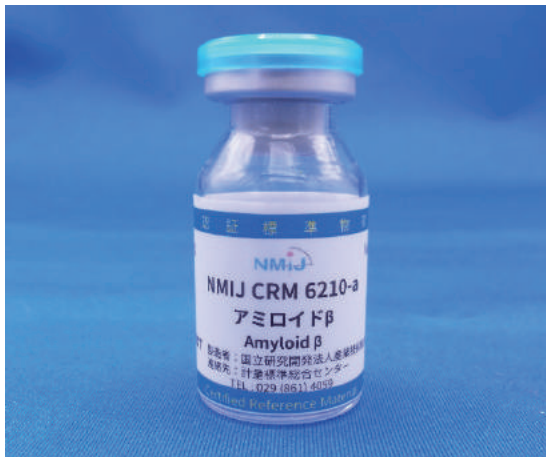
NMIJ CRM 6210-a アミロイドβ Amyloid β (P. 33)