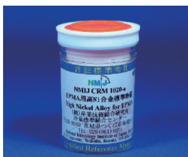
NMIJ CRM 1020-a EPMA 用高ニッケル合金 High Nickel Alloy for EPMA] (P. 12)

After rinsing the alloy surface with acetone or the like, CRM 1019-a and CRM 1020-a should be kept in dry and clean atmosphere such as a desiccator at room temperature.