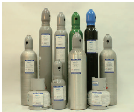
NMIJ CRMs 高圧ガス認証標準物質 Gas CRMs (P. 47 ~ P. 49)

* Each certified value shown in table above is an example. The certified value is slightly different in each cylinder.