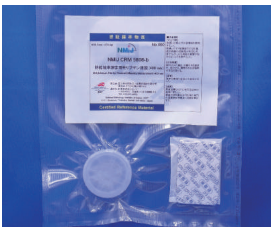
NMIJ CRM 5808-b 熱拡散率測定用モリブデン薄膜 (400 nm) Molybdenum Film for Thermal Diffusivity Measurement (400 nm) (P. 53)

詳細は、NMIJ ホームページ https://unit.aist.go.jp/qualmanmet/refmate/ をご覧下さい。 For more information, please visit our web site. https://unit.aist.go.jp/nmij/english/refmate/