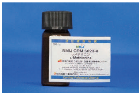
NMIJ CRM 6023-a

CRM 6007-a should be stored in a clean and dark environment at a temperature between 15 °C and 25 °C. It is recommended to store CRM 6007-a at a temperature around 5 °C, if storage for a longer period is needed.