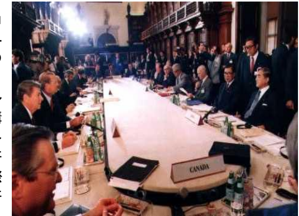
ヴェネチア・サミットの様子(1987年6月)

1989年に、この事業の実施のため、フランス・ストラスブールに国際ヒューマン・フロンティア・サイエンス・プログラム機構(HFSPO)が設置されました。1990年以降、主として研究グラント事業を通じて、世界の科学者の国境を越えた革新的な協同研究への支援を行ってきました。また、若手研究者に対し、国際的な研究の機会をもたらすフェローシップ事業や、独立した研究ポストへの就任を支援するキャリア・デベロップメント・アワード、さらに年に一度HFSP関係者が一堂に会する受賞者会合などの事業を行っています。