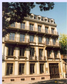
国際HFSP機構事務所(ストラスブール)